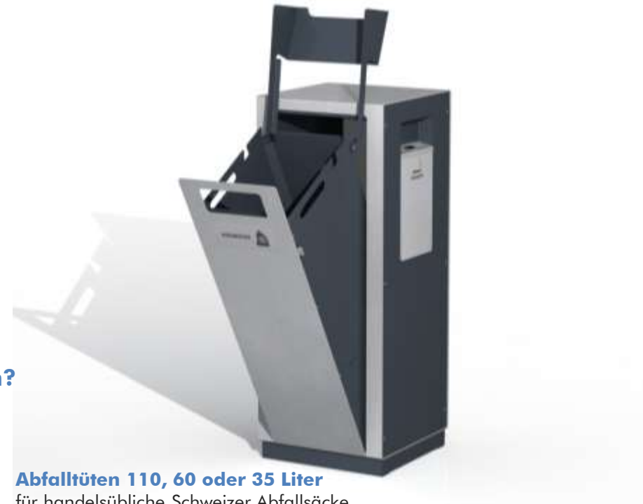
Abfalltüten 110, 60 oder 35 Liter für handelsübliche Schweizer Abfallsäcke