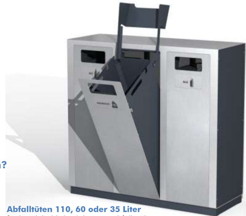
Abfalltüten 110, 60 oder 35 Liter für handelsübliche Schweizer Abfallsäcke