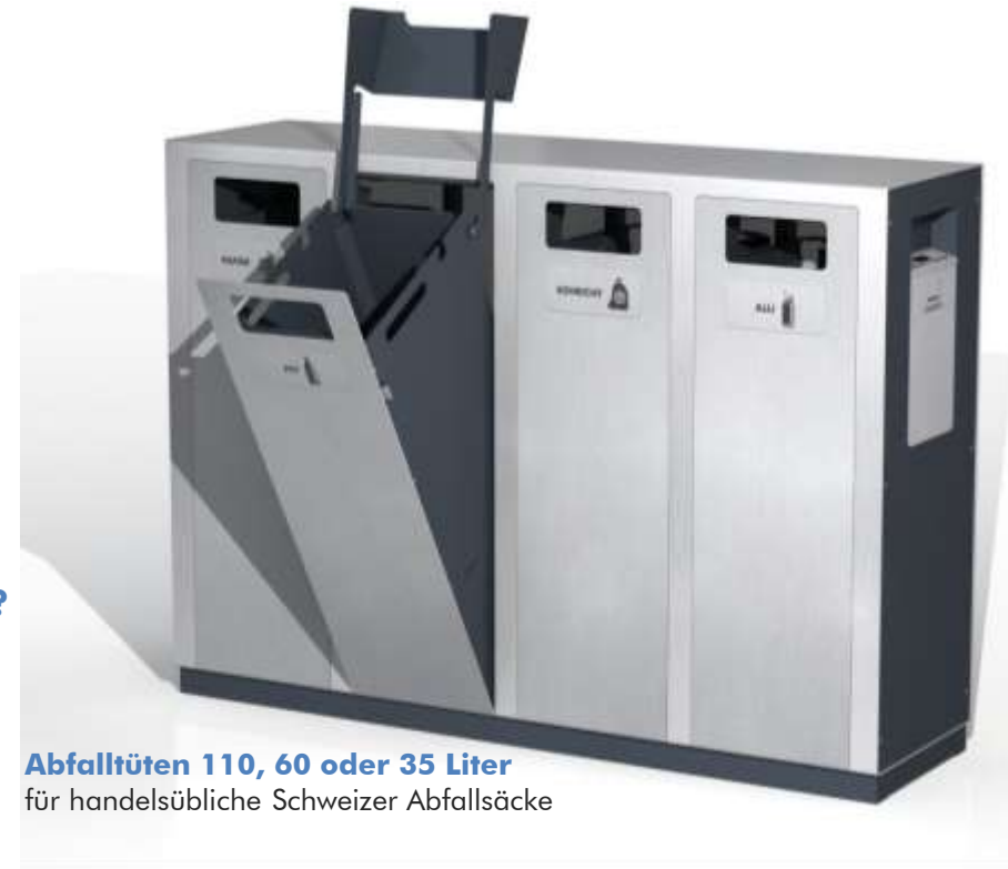
Abfalltüten 110, 60 oder 35 Liter für handelsübliche Schweizer Abfallsäcke