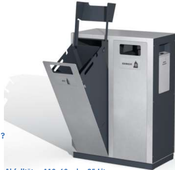
Abfalltüten 110, 60 oder 35 Liter für handelsübliche Schweizer Abfallsäcke